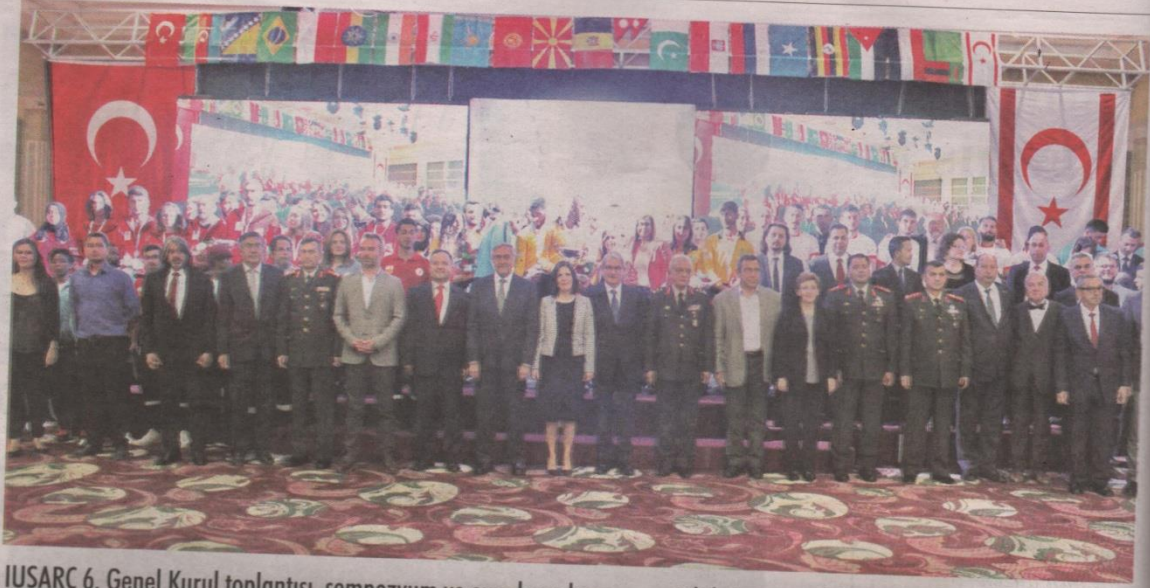
IUSARC 6. Genel Kurul toplantısı, sempozyum ve oyunların kapanışı ve ödül töreni yapıldı